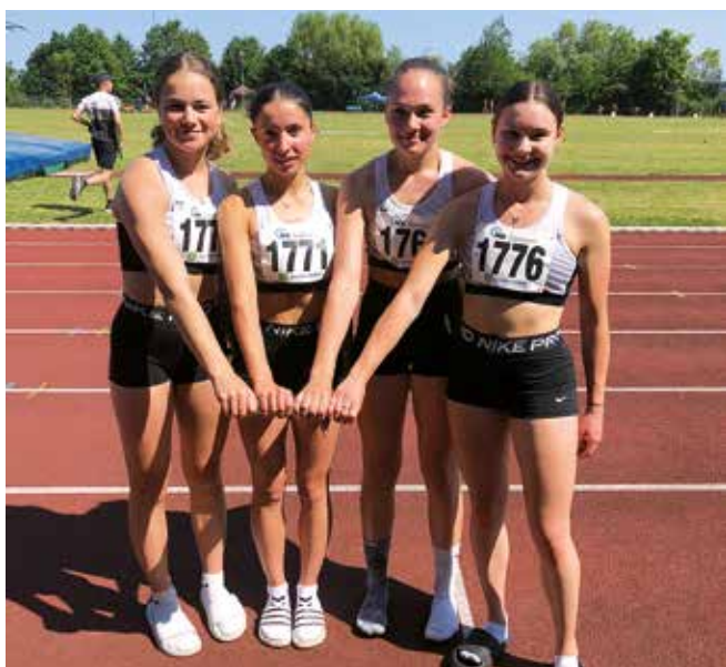
Saarlandmeisterinnen 4 x 100 m Jugend U20

Ihren Höhepunkt hatte sie bei den Süddeutschen U23 Meisterschaften. Hier sprintete sie also gerade mal 18-Jährige zum Titel über 100m. Die Siegeszeit von 11,70 Sekunden (bei leichtem Gegenwind) bedeuteten Bestleistung und einen neuen U20-Saarrekord. Der Rekord stammt noch aus dem letzten