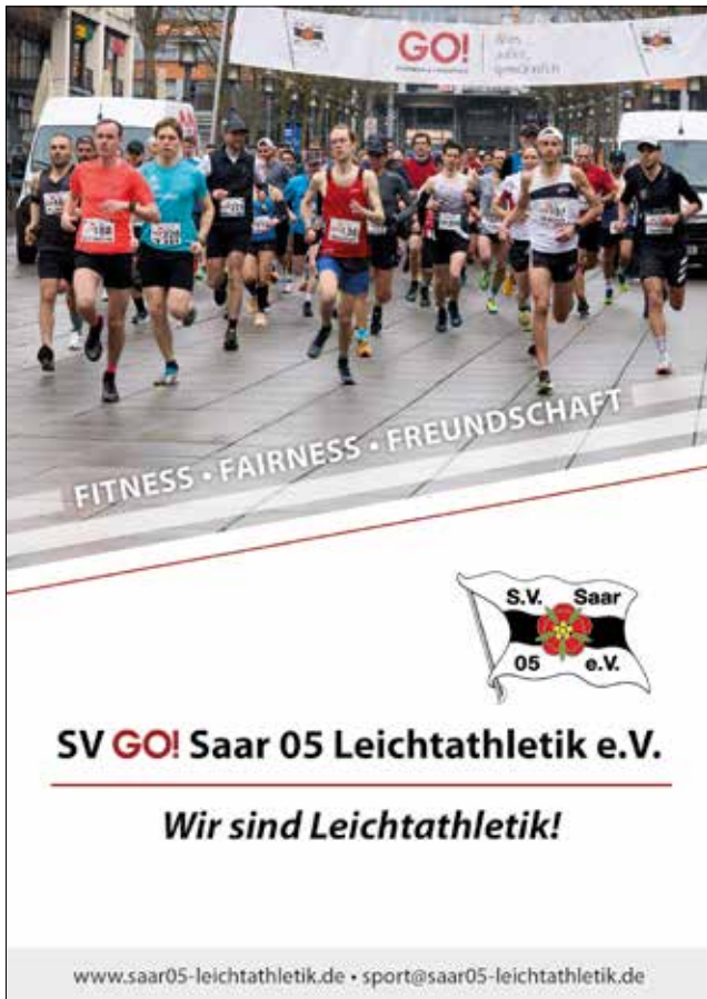
Das Cover der neuen Vereinsbroschüre

zeigen wir auf, wofür wir stehen: zahlreiche Fitnessangebote für alle Altersgruppen, Erziehung schon in jungen Jahren zu Fairness als elementarer Tu-