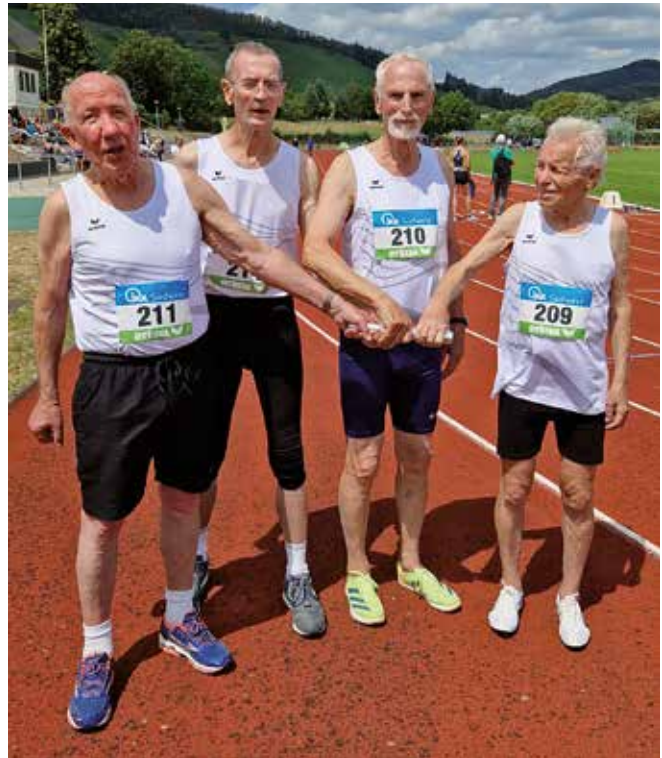
Die U80-Staffel von GO! Saar Express