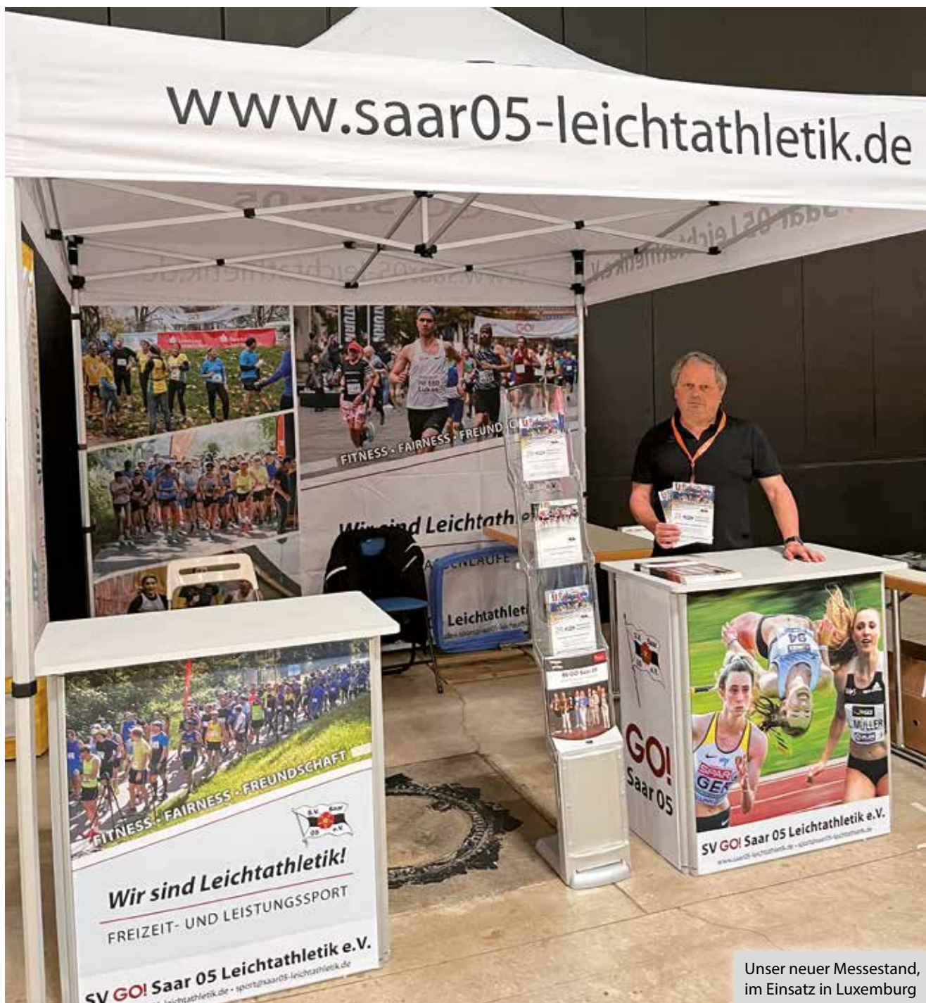
Unser neuer Messestand, im Einsatz in Luxemburg

wie die Resultate der Leistungs- und Seniorensportler positiv in Szene setzen.