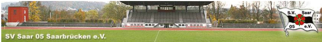
SV Saar 05 Saarbrücken e.V.